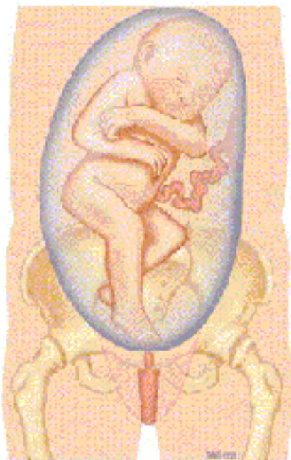
1d. Voetligging: benen gestrekt omlaag zodat een of beide voeten onder de billen ligt/liggen