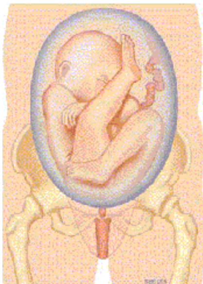
1c. Half (on)volkomen stuitligging: één been